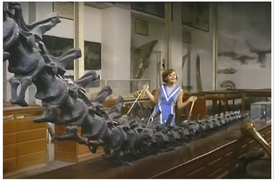
Cortes de la película Acompáñame dirigida por Luis César Amadori y protagonizada por Rocío Durcal