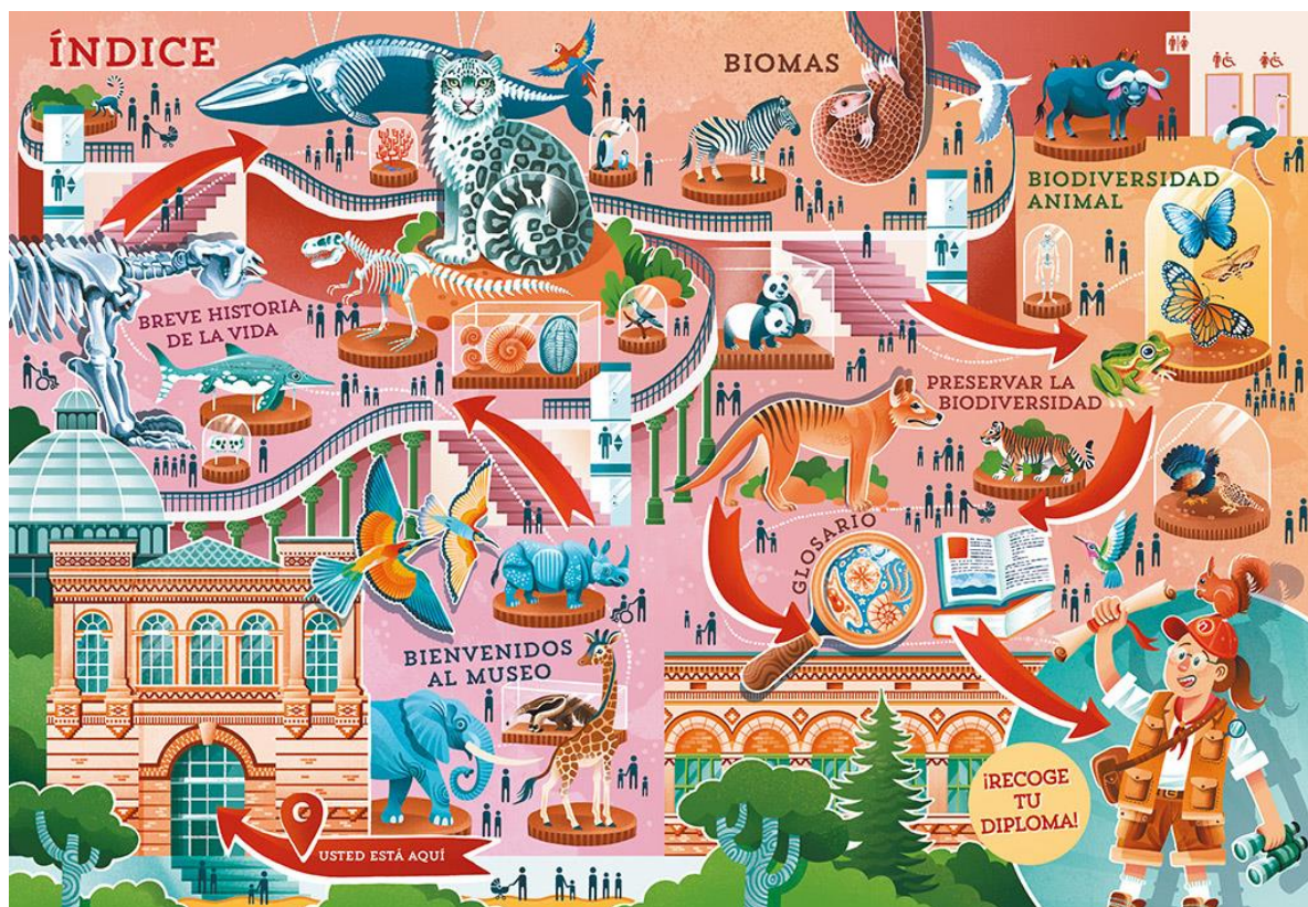
Índice del libro. / Diego R. Robredo

También se incluye un glosario con términos que se destacan a lo largo del libro y un diploma para los jóvenes, quizá futuros científicos, que lleguen hasta el final de sus páginas.