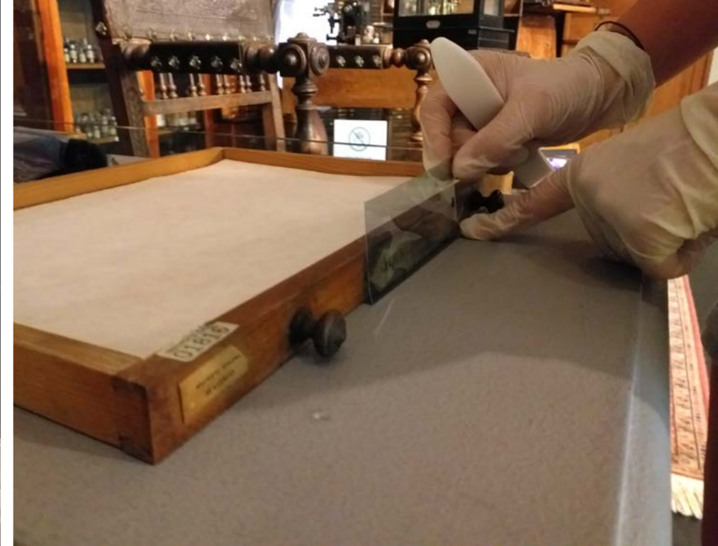
Instalación filtros UV en los cajones de los muebles la exposición El legado histórico de Santiago Ramón y Cajal

● ● Mientras esperamos la creación del Museo Cajal, el MNCN tiene el mandato institucional de contribuir a la conservación, interpretación, exhibición y difusión de los bienes que componen este importantísimo legado