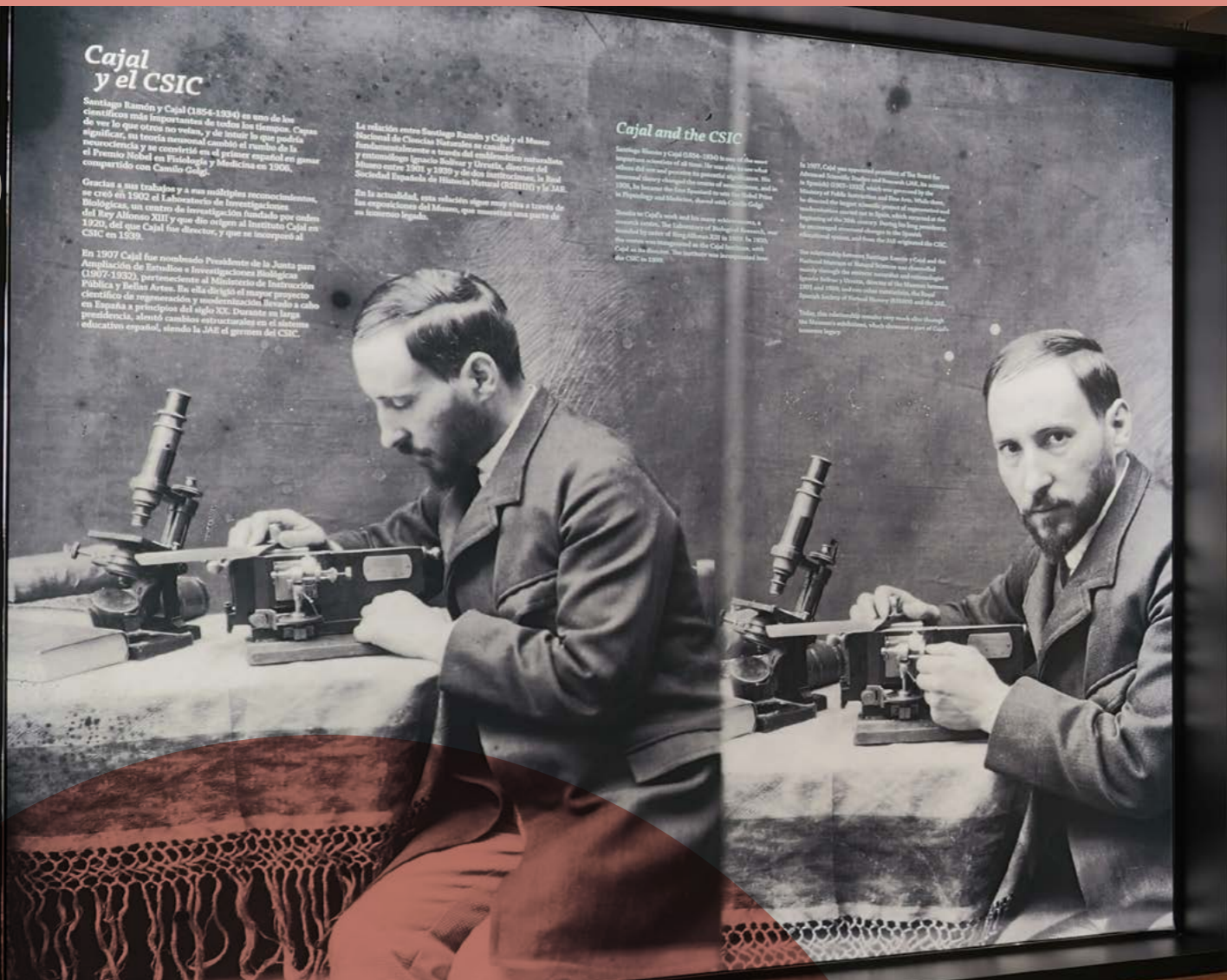
Uno de los retratos de Ramón y Cajal que forman parte de la muestra que se exhibe en el MNCN-CSIC

Entre estos bienes destacamos los casi 1950 dibujos científicos originales realizados a mano alzada por Cajal. Su valor es extraordinario y en ellos se aprecia su faceta de artista e investigador : con ellos convenció a la comunidad científica internacional de su nueva teoría, pues representaban fielmente lo que su ojo percibía a través del microscopio: la complejidad del sistema nervioso y la individualidad de la célula neuronal.