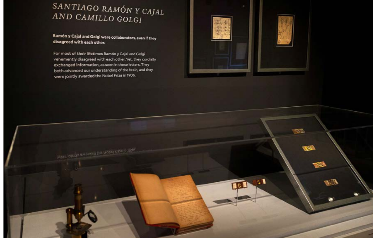
Cajal y Golgi, por primera vez juntos, en la exposición Mind/Matter: The Neuroscience of Perception, Attention, and Memory / Museo Peabody, Universidad de Yale