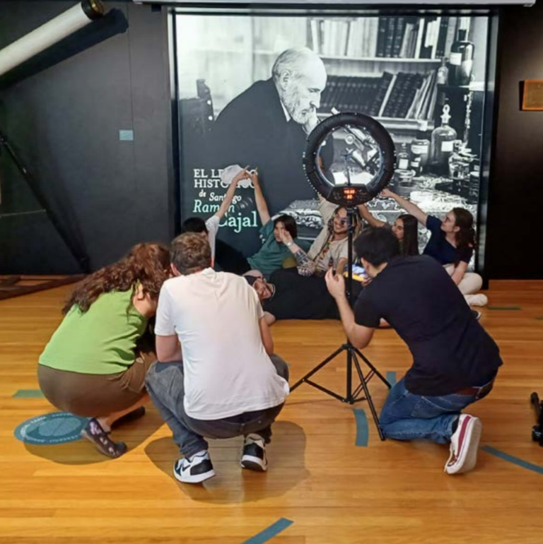
Fotografía del rodaje del RAP conCIENCIA en la Escuela, organizado por el Instituto de Química Física Blas Cabrera / IQF-CSIC