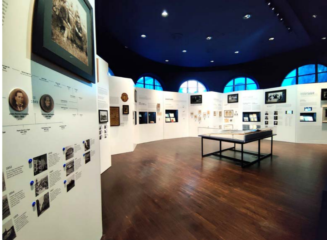
Espacio Cajal en el edificio Paraninfo, Universidad de Zaragoza. Queremos poner en valor la colaboración activa con la Universidad de Zaragoza, donde en este tiempo hemos participado prestando dibujos para dos muestras de su Espacio Cajal y más recientemente para la exposición Aragón en los ojos de Cajal

El legado consta de más de 28.000 bienes patrimoniales que abarcan desde piezas textiles, instrumental científico-técnico, preparaciones histológicas o dibujos, además de un importante archivo fotográfico