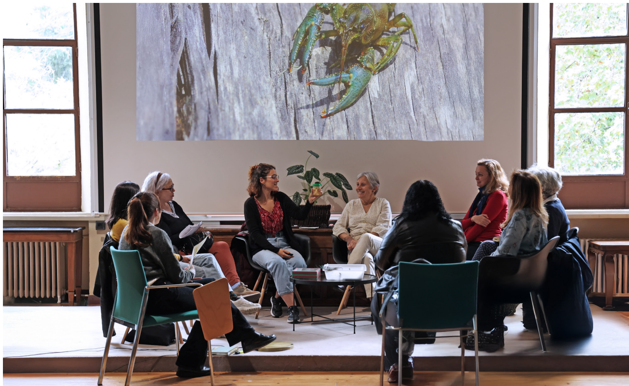
Club de lectura La tejonera celebrado en el salón de actos del MNCN-CSIC.

● ● Un 38,5% y un 46,2% creen que su interés por la ciencia ha aumentado mucho y bastante, respectivamente, a raíz de participar en La tejonera