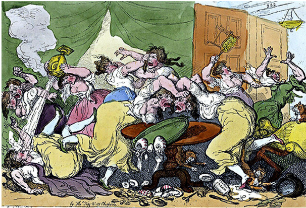
Breaking Up of the Blue Stocking Club, caricatura de las bluestockings de Thomas Rowlandson (1815)

club de lectura de la actriz y productora Reese Witherspoon o el de la periodista Oprah Winfrey. Ya sean conocidos o no, cada día nacen más clubes de lectura en todo el mundo con una gran variedad de formatos como el digital, a través de redes sociales, el virtual o el presencial con estrategias diversas como acompañar las charlas con un vino, café o vermouth o la conquista de espacios como museos, librerías y otras instituciones culturales.